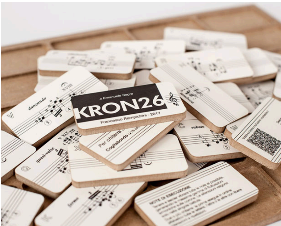
↑ Kron 26.

Ispirato dalle melodie interscambiabili di Rampichini – da eseguire con una o più chitarre combinando in qualsiasi ordine 26 “tasselli musicali” (26 come le lettere dell’alfabeto con cui sono identificati) – Lariani ha ideato e prodotto dei mini-pentagrammi in bilaminato Pvc-Mdf che si inseriscono a incastro nel “telaio” dello spartito creando una superficie perfettamente levigata e a filo. Lariani ha realizzato lo spartito con Mdf: ciascun tassello con angoli stondati è tagliato a laser ed è perfettamente leggibile grazie alla verniciatura trasparente opaca anti-riflesso.