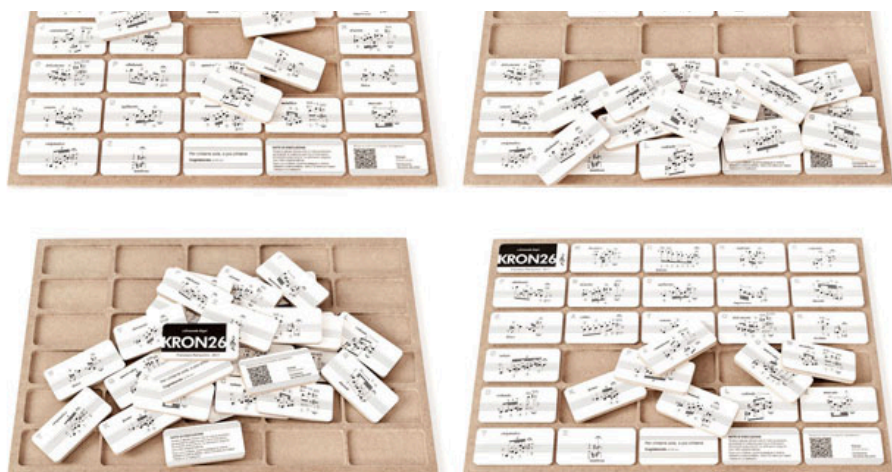
↑ Kron 26 è uno spartito a tessere intercambiabili: le sequenze musicali possibili sono 403 milioni di miliardi di miliardi.

Ispirato dalle melodie interscambiabili di Rampichini – da eseguire con una o più chitarre combinando in qualsiasi ordine 26 “tasselli musicali” (26 come le lettere dell’alfabeto con cui sono identificati) – Lariani ha ideato e prodotto dei mini-pentagrammi in bilaminato Pvc-Mdf che si inseriscono a incastro nel “telaio” dello spartito creando una superficie perfettamente levigata e a filo. Lariani ha realizzato lo spartito con Mdf: ciascun tassello con angoli stondati è tagliato a laser ed è perfettamente leggibile grazie alla verniciatura trasparente opaca anti-riflesso.