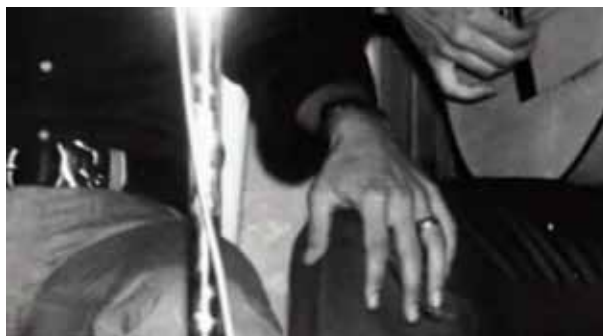
Paco e Camarón

brò lunghissimo continuando la conversazione. Poi tutti si alzarono e stringendomi il ginocchio mi fece cenno di restare. Un gesto, scoprii poi, che l'amico di tante avventure, il cantaor Camarón de la Isla usava con lui («Il più grande genio che abbia mai conosciuto. Penso che lo strumento più puro che esista sia la voce umana»).